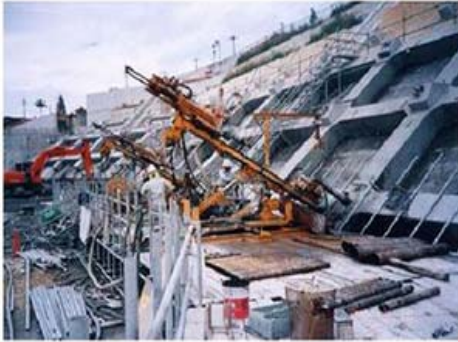
グラウンドアンカー施工